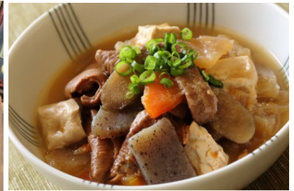
《肉料理とも相性良し》