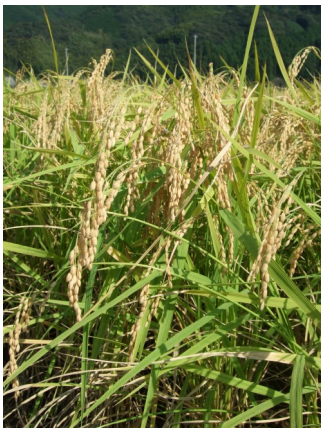
【生産地が明確な米です】

開龍の原料米となる「山田錦」は藤枝市朝比奈地区で栽培されます。朝比奈地区は、山間部に位置し、暑い夏でも夜は冷え込みます。この気温差が、米により影響を与えます。令和6年度の夏は非常に暑く多くの酒米が品質を落とす中「朝比奈・山田錦」は例年と変わらない素晴らしい出来でした。